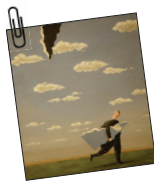
طرح جلد: gerhard gepp